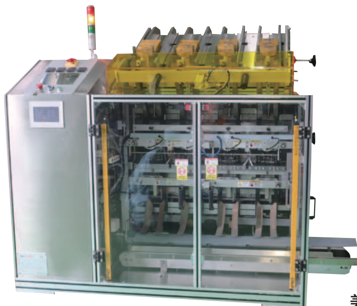
美容マスク4連充填機

中国メーカーの専用機の取り扱いが可能です。 仕様打合せや輸入業務、試運転確認・納品は当社が担当させていただきます。