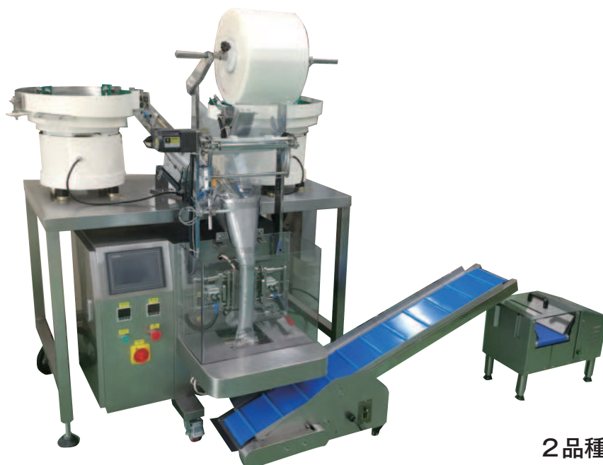
2品種計数・包装機

■本 社 〒 577-0017 大阪府東大阪市藤戸新田1-4-15 Tel. 06-6787-2188 Fax.06-6787-0797